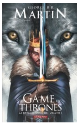
A Game of Thrones - La Bataille des rois - tome 1