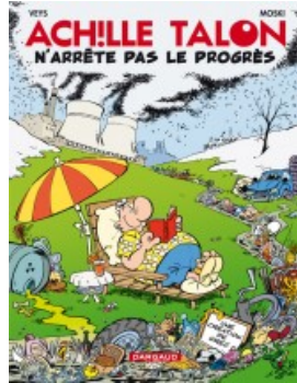
Achille Talon n'arrête pas le progrès