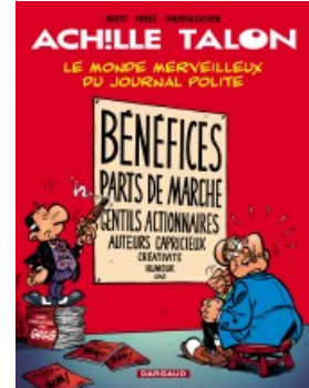
Le Monde merveilleux du journal Polite