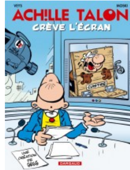
Achille Talon crève l'écran