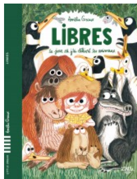
Libres - Le jour où j'ai délivré les animaux