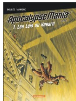
Les Lois du hasard