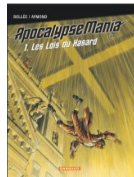
Les Lois du hasard