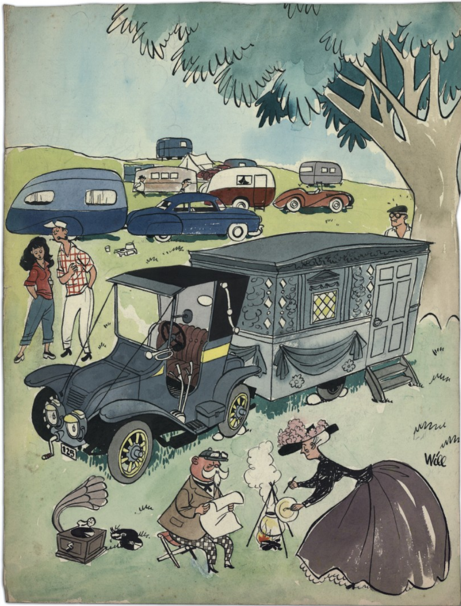
Jijé derrière un arbre : dessin pour une revue des éditions Dupuis (fin des années 40)