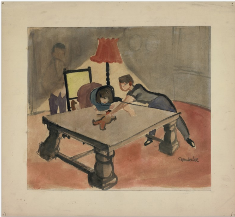
Cassis : les enfants Gillain (début des années 50).