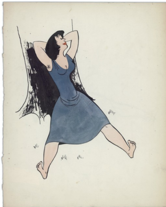
Sieste à l'ombre d'un platane (début des années 50).