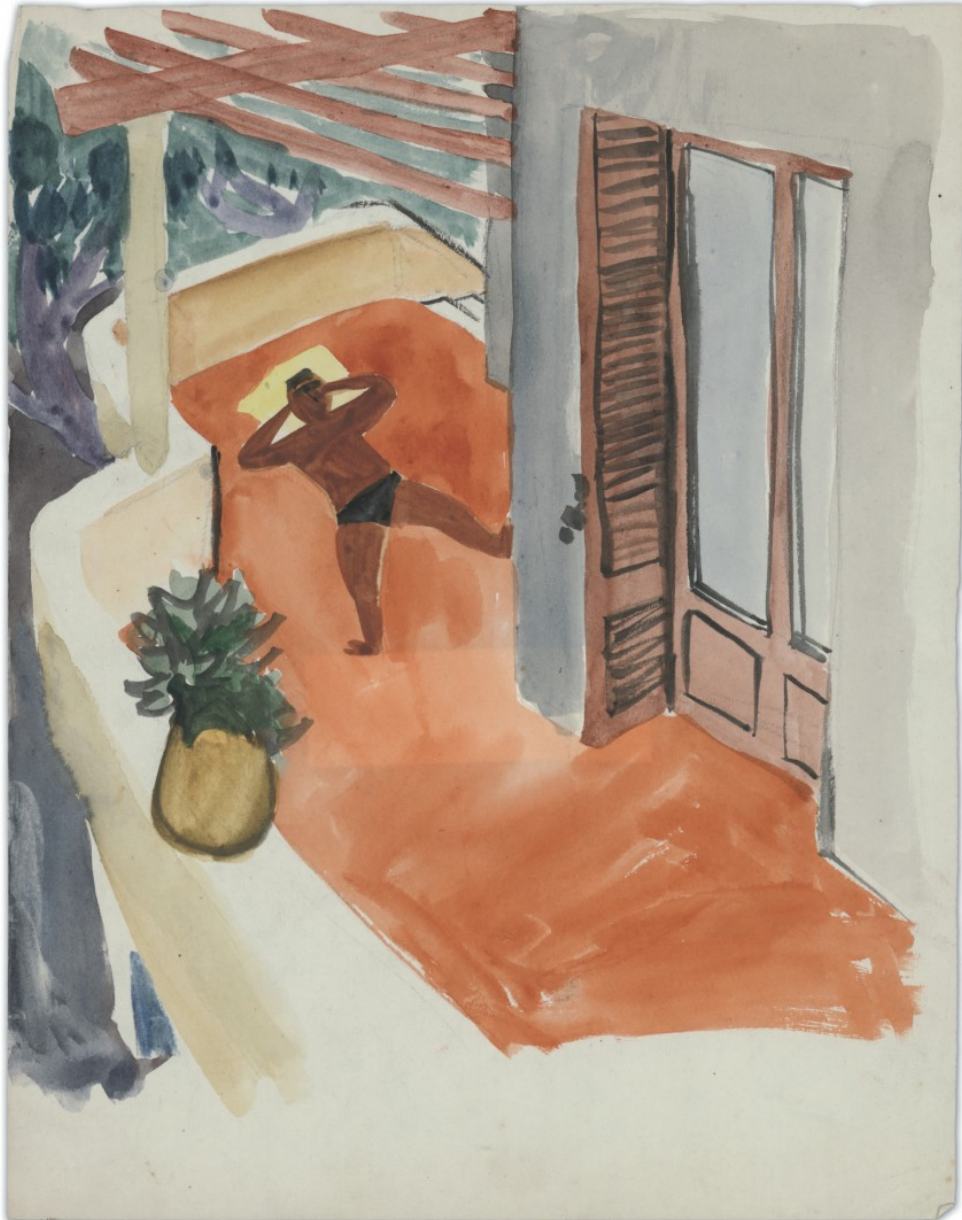
Une sieste à Cassis (début des années 50).