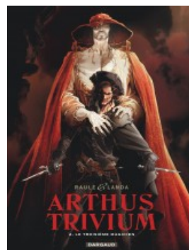
Le Troisième Magicien