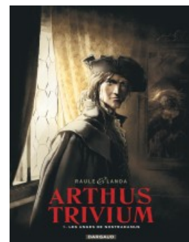
Les Anges de Nostradamus