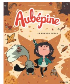
Le renard furax