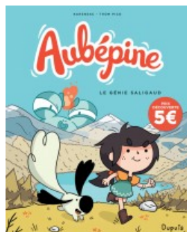
Le Génie Saligaud