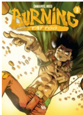
BURNING TATTOO T03