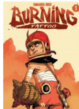
BURNING TATTOO T01