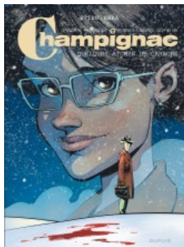
Quelques atomes de carbone