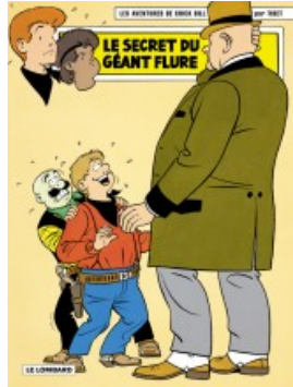
Le Secret du géant Flure