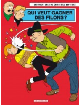
Qui veut gagner des filons ?