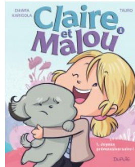
Joyeux Prémensiversaire !