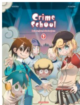
Bolos un jour bolos toujours