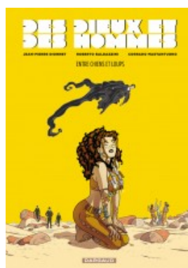
Entre chiens et loups