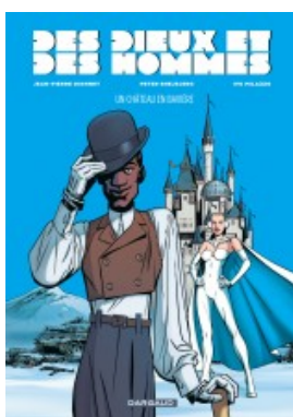
Un château en Bavière