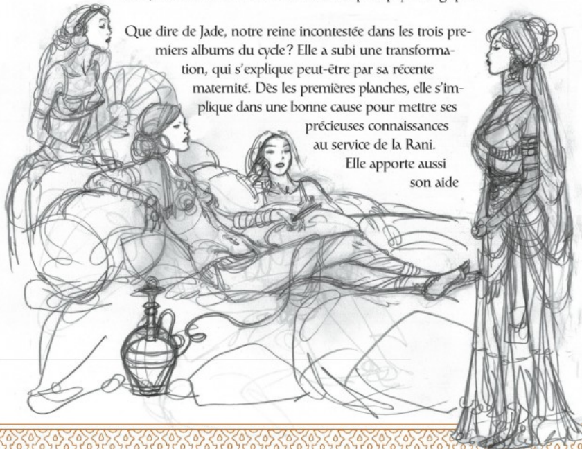
CI-CONTRE: Miranda face à Arbacane.