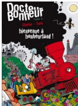
Bienvenue à bonheurland !