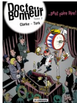
...peut faire pire