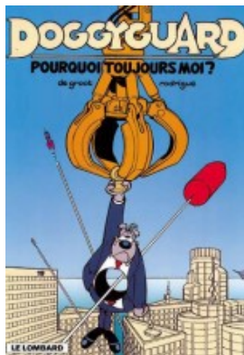
Pourquoi toujours moi ?