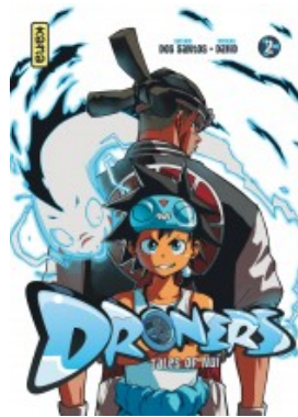
Droners - Tales of Nui T2