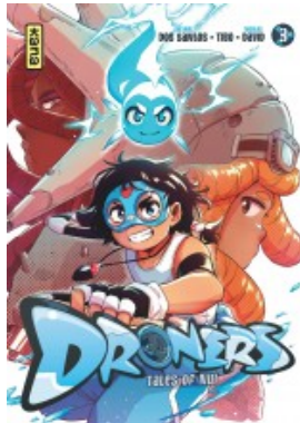
Droners - Tales of Nui T3