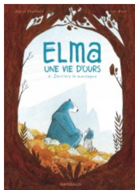
Derrière la montagne