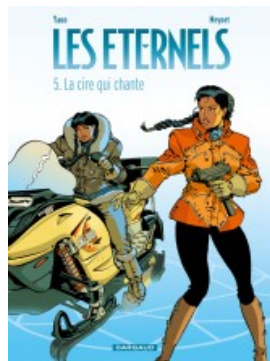
La Cire qui chante