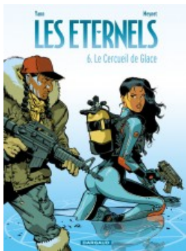
Le Cercueil de glace