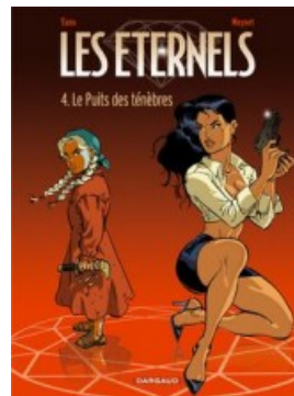
Le Puits des Ténèbres