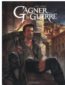
La Mère patrie