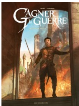
Retour en grâce