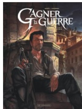
La Mère patrie