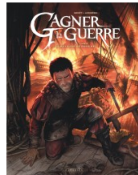
Le Royaume de Ressine