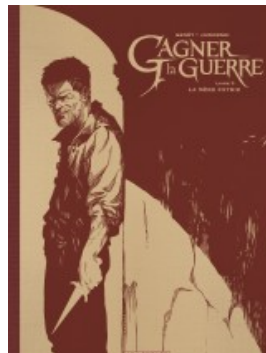
La Mère patrie