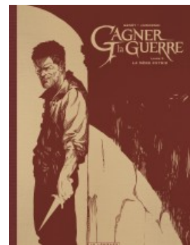
La Mère patrie