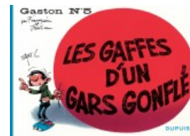
Les gaffes d'un gars gonflé