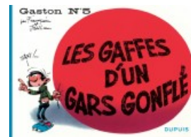
Les gaffes d'un gars gonflé