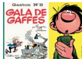
Gala de gaffes