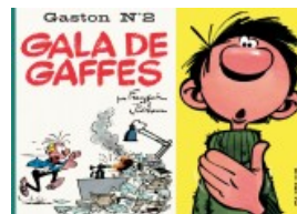
Gala de gaffes