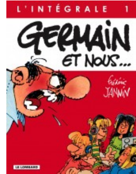
Germain et nous - Intégrale T1