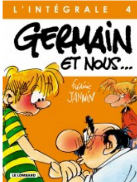
Germain et nous - Intégrale T4