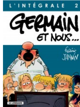
Germain et nous - Intégrale T2