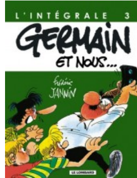
Germain et nous - Intégrale T3