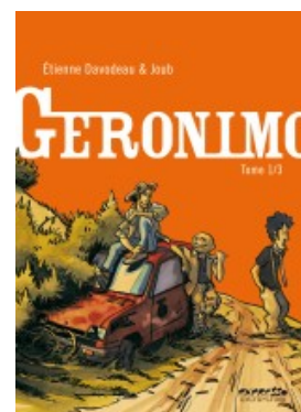
Geronimo - tome 1/3