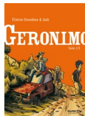
Geronimo - tome 1/3