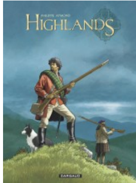
Highlands - Intégrale complète