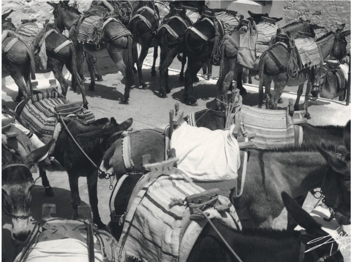
« Sur l'île Santorin, les ânes servent d'ascenseur pour monter dans la ville située sur les hauteurs. Parmi eux, cherchez Anatole... »