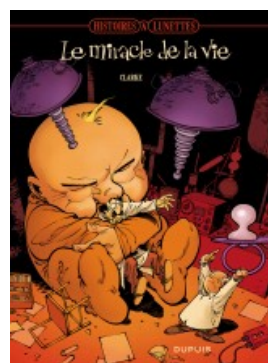
Le miracle de la vie