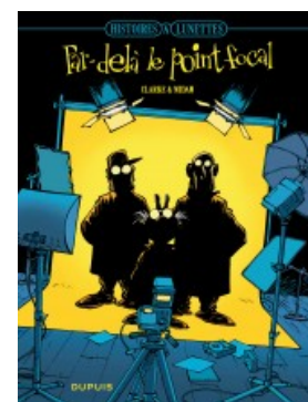
Par delà le point focal