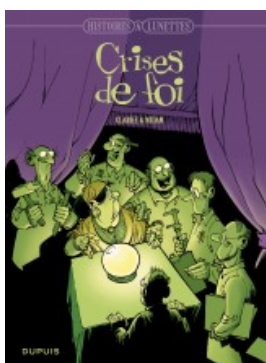
Crises de foi