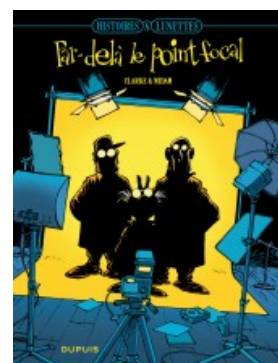
Par delà le point focal