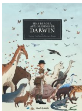
HMS Beagle Aux origines