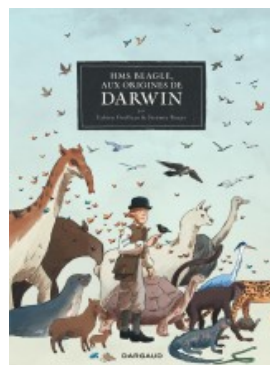
HMS Beagle Aux origines