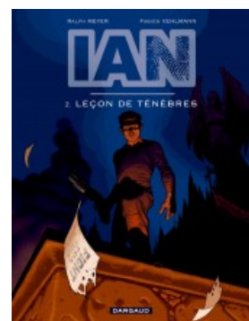
Leçon de ténèbres