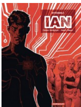
IAN - Intégrale complète