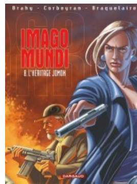
Héritage Jomon (L')