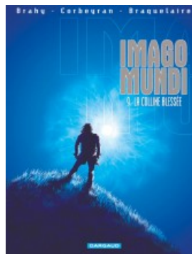
Colline blessée (La)