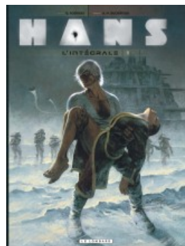
Intégrale Hans 1