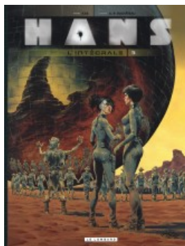
Intégrale Hans 3