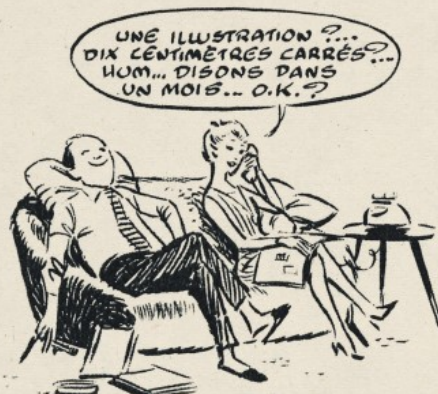
Comme ils se voyaient...