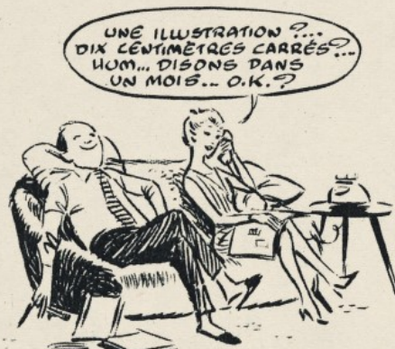
Comme ils se voyaient...