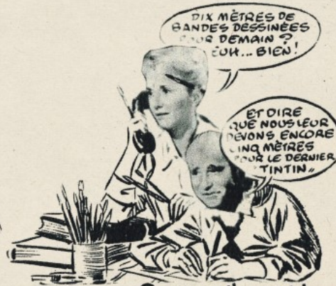
Comme ils sont !

Un «collector» souriant : l'autodérision des Funcken caricaturés par eux-mêmes.