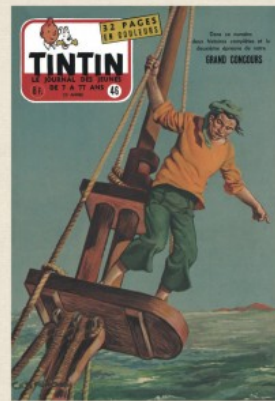
D'autres aventures à terre ou en mer paraissent régulièrement dans le journal Tintin.