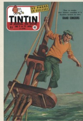
D'autres aventures à terre ou en mer paraissent régulièrement dans le journal Tintin.