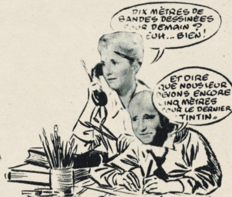
Comme ils sont !

Un «collector» souriant : l'autodérision des Funcken caricaturés par eux-mêmes.