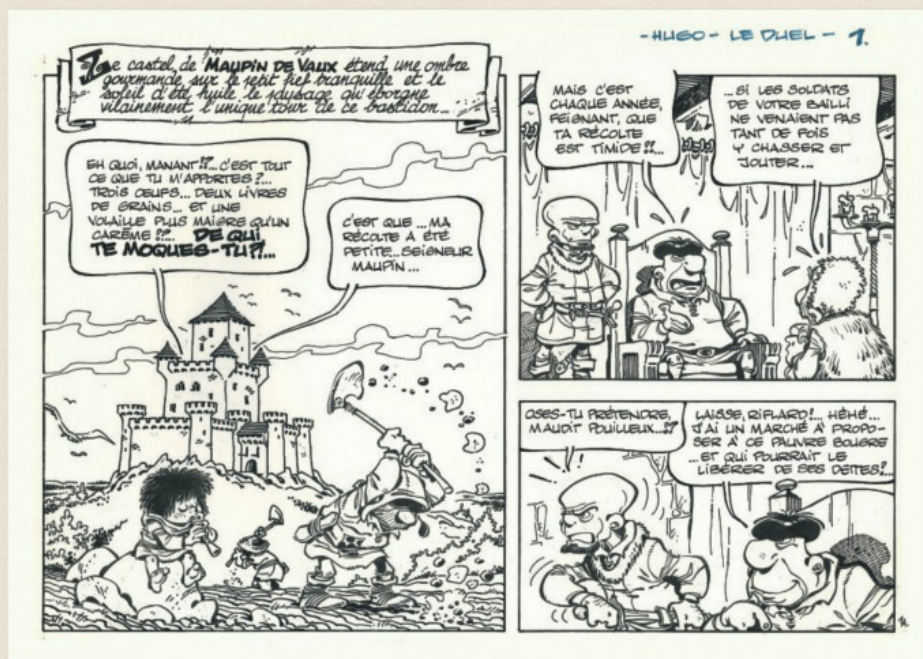
Le Duel, partie supérieure de la planche 1.