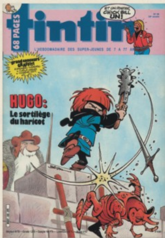
Couverture du Tintin belge n° 49 (58 e année) et du Tintin français n° 430, du 6 décembre 1983.