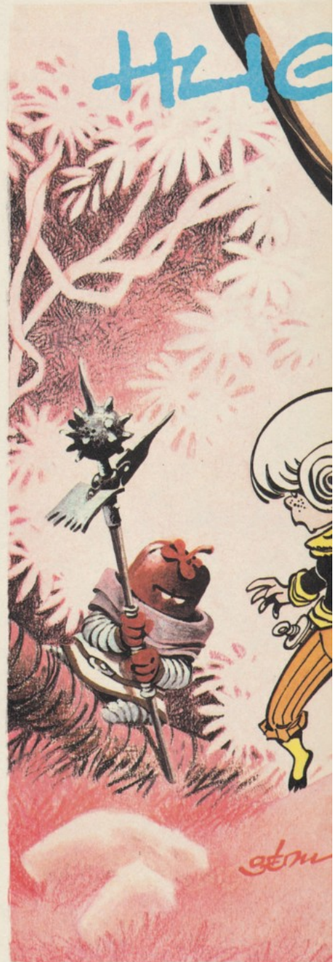
Poster réalisé en 1983 à l'occasion de la publication du Sortilège du haricot .

Une quête qui va également permettre à l'auteur d'imaginer d'autres amusantes créatures comme cet aspiroquet , une sorte de dragon aspirateur-prison. « C'est sorti d'un coup. J'ai toujours bien aimé faire bouger les objets. On peut tout faire bouger, une chaise peut devenir très amusante à animer à un certain moment, tout dépend sous quel angle on la regarde, où l'on va placer la bouche, les yeux. Comment utiliser les pieds pour la faire avancer, lui donner de l'expression. C'est comme ça qu'arrive ce personnage un peu curieux, genre aspirateur, mais en même temps cage à oiseaux. » Une cage bien chatouilleuse, on le découvrira. L'histoire fourmille d'inventions, tel Nefraïm, une sorte de bateau-personnage rigolo: « À partir du moment où le personnage tient la route, est crédible, on se dit: "Pourquoi pas?" » Ou bien encore ce sablier, planche 38, symbolisant le passage d'une main à l'autre; le passage du temps.