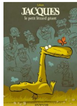
Jacques le petit lézard géant