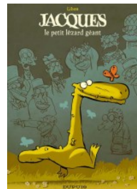
Jacques le petit lézard géant