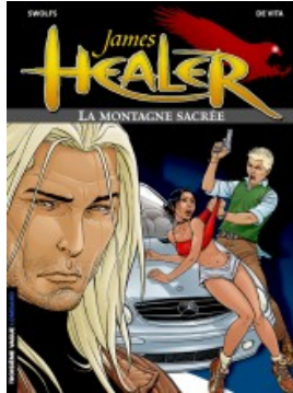
La Montagne sacrée