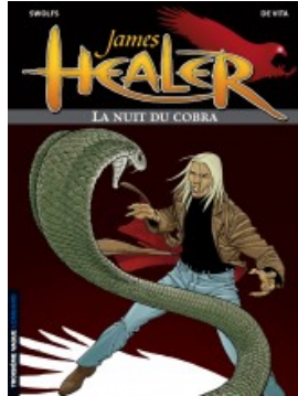
La Nuit du cobra