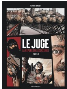
Le Juge la République assassinée - tome 2