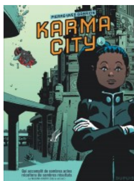
Karma City 1/2