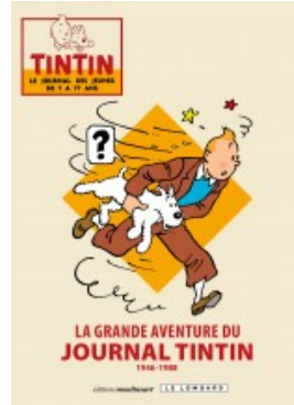
La grande aventure du journal Tintin