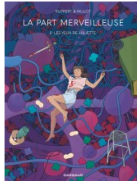
Les Yeux de Juliette