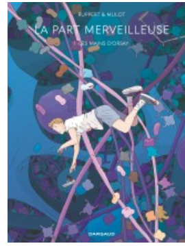
Les Mains d'Orsay