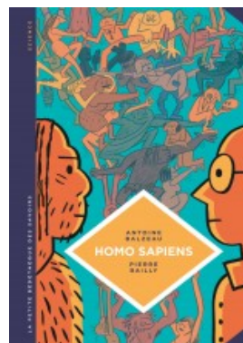
Homo Sapiens. Histoire(s) de notre humanité.