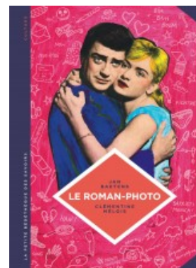
Le Roman-photo. Un genre entre hier et demain.