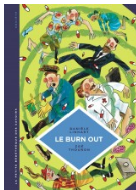
Le Burn out