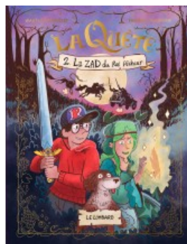
La ZAD du roi pêcheur