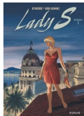
Lady S - Nouvelle intégrale - Tome 1