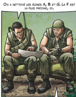
OK, on commencera par là, puis on descendra vers le sud-est pour traverser la vallée de la Drang, pour atteindre la zone C ?