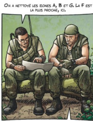
OK, on commencera par là, puis on descendra vers le sud-est pour traverser la vallée de la Drang, pour atteindre la zone C ?