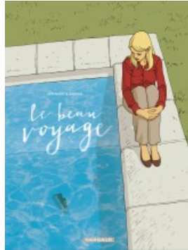
Le Beau Voyage