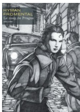
Le Coup de Prague