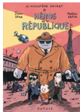
Héros de la République