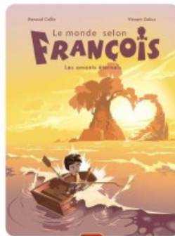
Les amants éternels