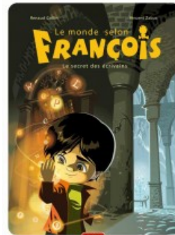
Le secret des écrivains