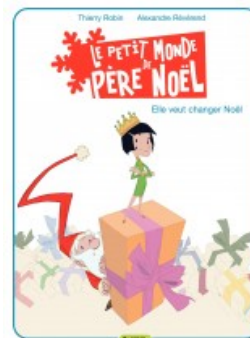
Elle veut changer Noël