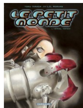
Vamos vamos !