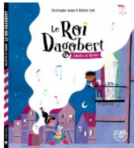
Le roi Dagobert : Juliette & Roméo