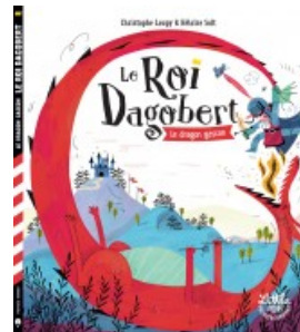
Le Roi Dagobert et le dragon gascon