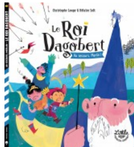
Le roi Dagobert : Au secours Merlin !